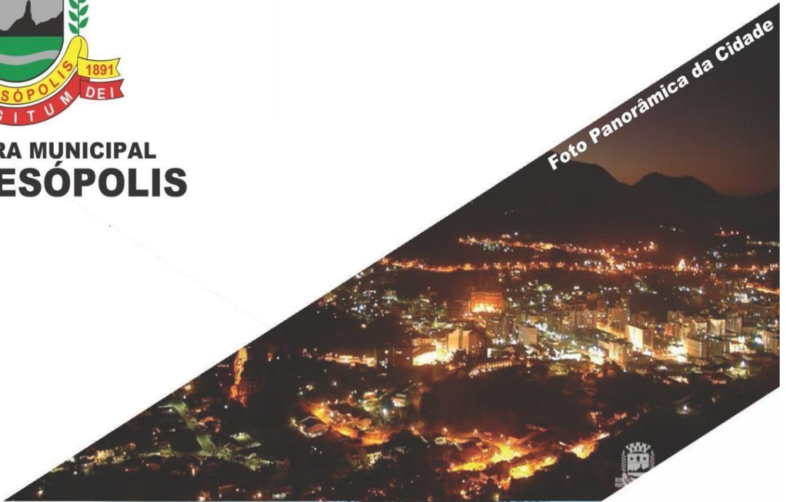
Foto Panorâmica da Cidade

PMT-RJ PROCESSO Nº 30.467/2021 RUBRICA: FLS: