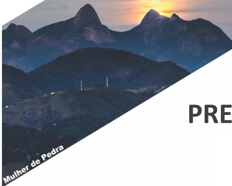
Foto Panorâmica da Cidade