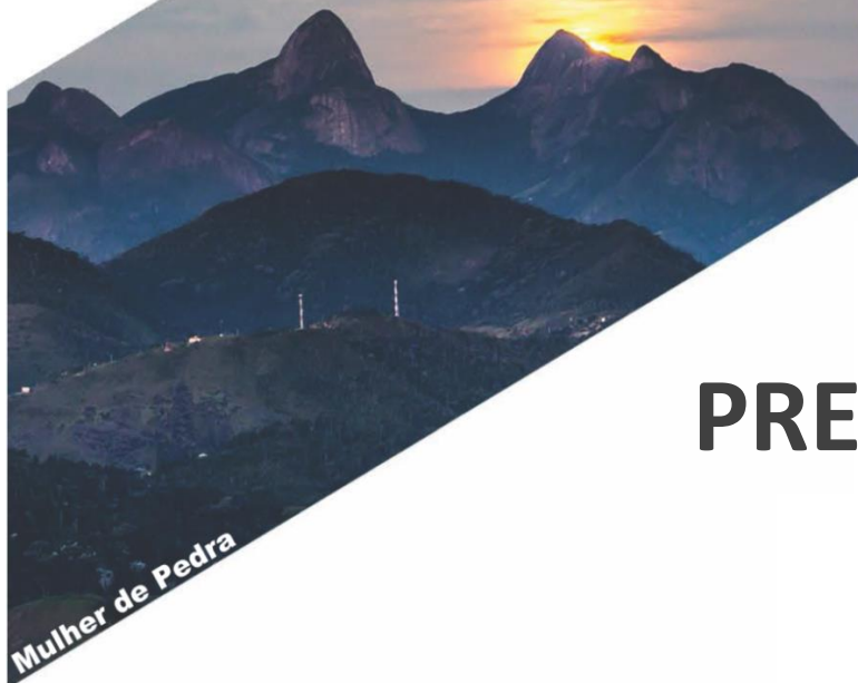
Foto Panorâmica da Cidade