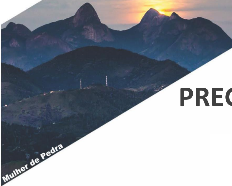
Foto Panorâmica da Cidade