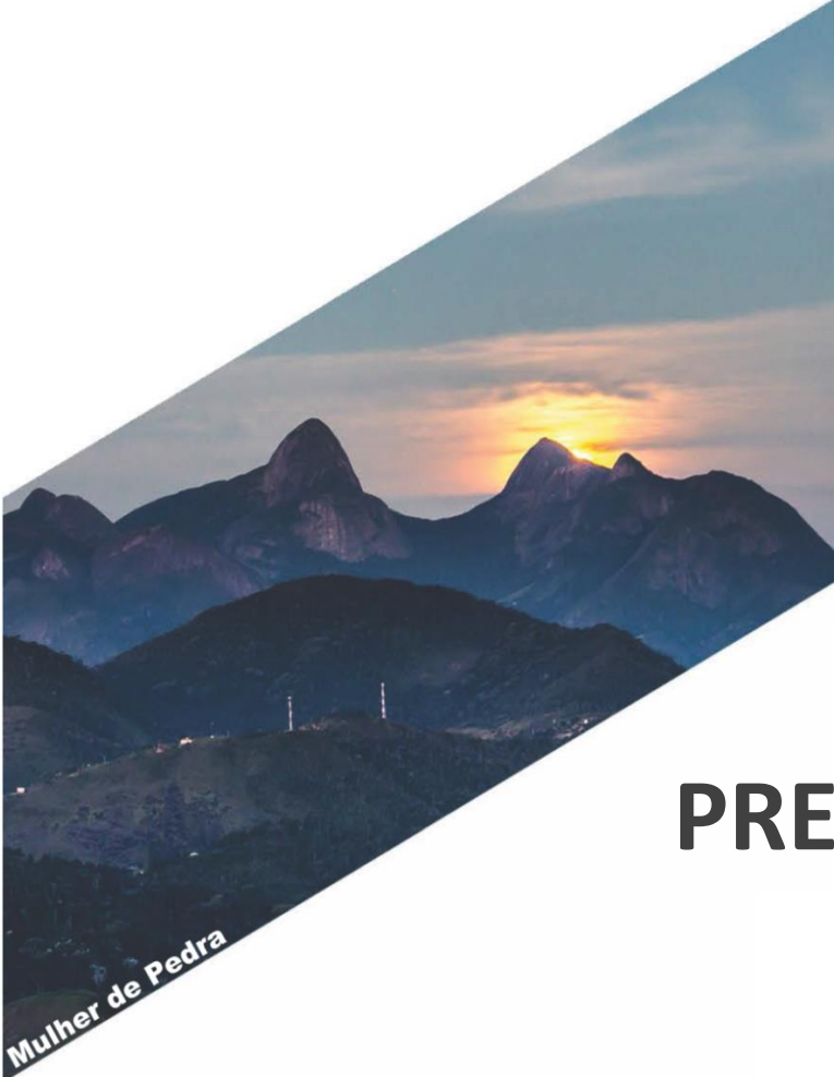
Foto Panorâmica da Cidade